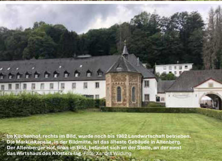
Im Küchenhof, rechts im Bild, wurde noch bis 1982 Landwirtschaft betrieben. Die Markuskapelle, in der Bildmitte, ist das älteste Gebäude in Altenberg. Der Altenberger Hof, links im Bild, befindet sich an der Stelle, an der einst das Wirtshaus des Klosters lag.