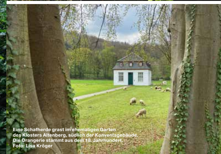
Eine Schafherde graszt im ehemaligen Garten des Klosters Altenberg, südlich der Konventsgebäude. Die Orangerie stammt aus dem 18. Jahrhundert.