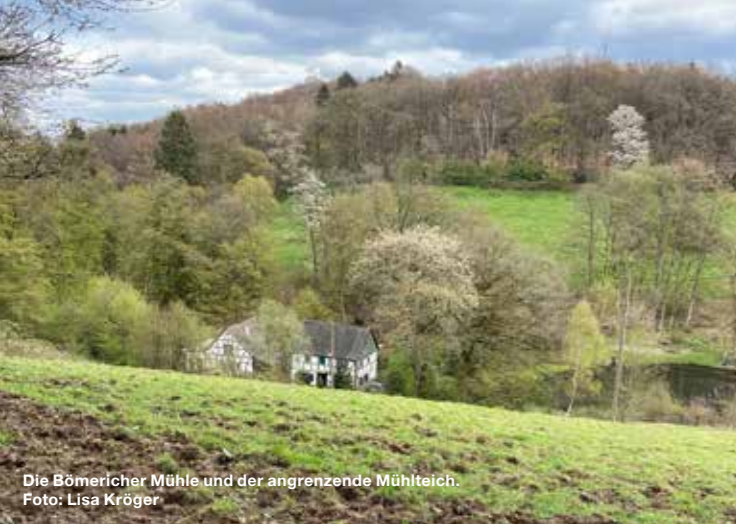
Die Bömericher Mühle und der angrenzende Mühlteich.