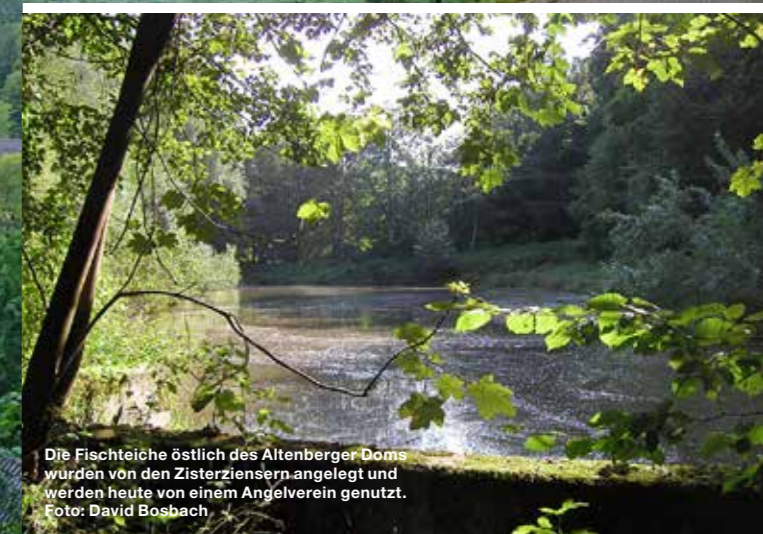
Die Fischteiche östlich des Altenberger Doms wurden von den Zisterziensern angelegt und werden heute von einem Angelverein genutzt.