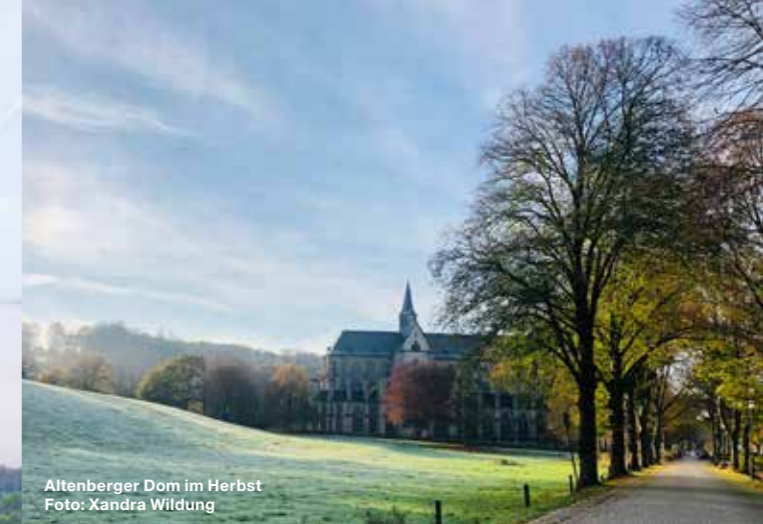
Altenberger Dom im Herbst