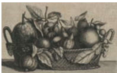
Ilustrace Johann Christoph Volckamer: Nurembergische Hesperides, Norimberk, 1708 [Bavorská státní knihovna Mnichov VD18 14760916- 001], s. 51, 38.