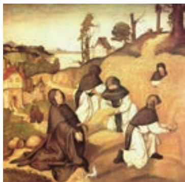
Cisterciáci sklízí obilí, detail z opatství Bernhard Altar Abbey Zwettl, Jörg Breu starší. A.