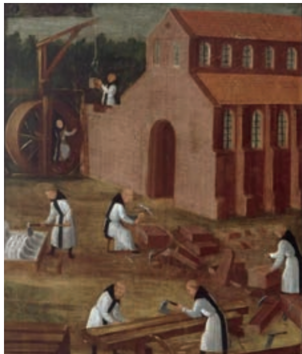
Cisterciáci staví klášterní kostel. Maulbronn základní deska, detail.

V téže roce byly položeny základní kameny dnešního klášterního kostela. Michalská kaple byla vysvěcena již v roce 1207. Dokončení velké gotické baziliky trvalo až do roku 1285.