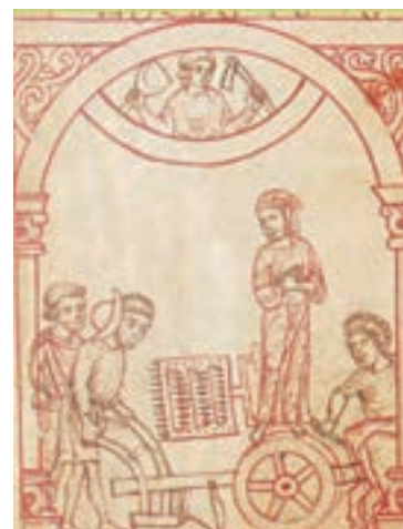
Vyobrazení cisterciáckého zemědělství v Reiner Musterbuch ukazuje mimo jiné kolový pluh. ÖNB c. 507, 120 8-13, f 1v

S cisterciáky se rozšířily i kulturní techniky jako kolový pluh a trojpolní hospodaření. Často jsou prezentovány i zemědělské aktivity. Jsou součástí sebeobrazu řádu.