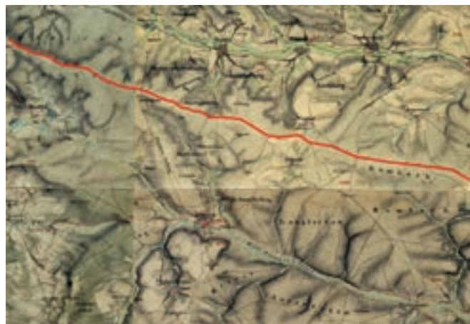
v červeném průběhu vysoké silnice Würzburg-Bamberg

Zda takové přesídlení probíhalo systematicky, ve smyslu „farmářského osídlení“, nelze v pramenech dohledat. Zarážející je však kumulace těchto procesů v oblasti cistercií.