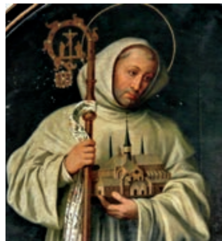
Bernhard von Clairvaux, Vera effigies, cca 1700, refektář v opatství Rein, detail