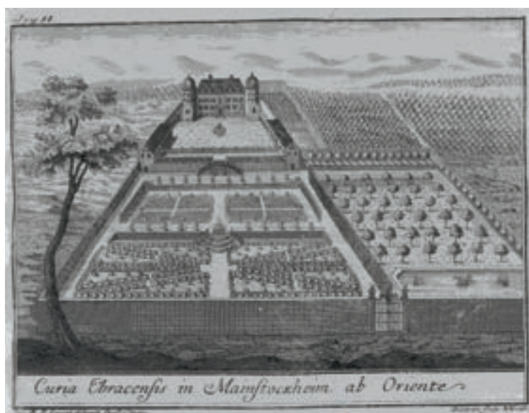
Rytiny oficiálních hradů Ebrach z Brevis Notitia, výběr. Bamberská státní knihovna