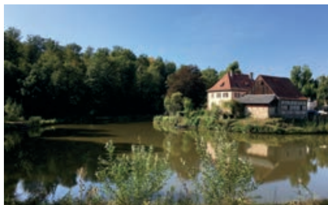
Winkelhof s okolním rybníkem